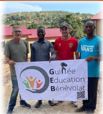
Chers adhérents et donateurs,

D epuis avril, deux missions se sont rendues sur place à Mamou, en août et octobre. Le but est de suivre au plus près l'évolution du chantier, mais aussi de mettre en place les activités, rencontrer les officiels, et surtout l'équipe enseignante et les enfants.